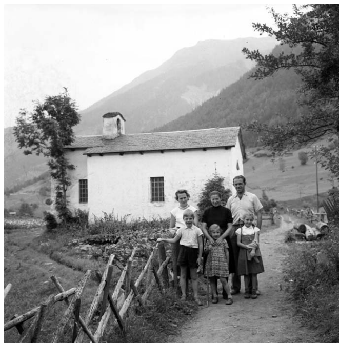
Der mit einem «Schrathag» begrenzte Saumweg bei der Kapelle in Zenhäusern um 1957

entsprachen. Sie wurden geschlossen. Im Oberwallis sind wenige dieser Gebäude noch erhalten. Nachdem sie mit der auch in den Agrargemeinden einsetzenden Technisierung ihre Funktion verloren hatten, war wegen ihres kollektiven Besitzes niemand mehr für deren Unterhalt verantwortlich. Sie verfielen und wurden abgebrochen oder umgenutzt.