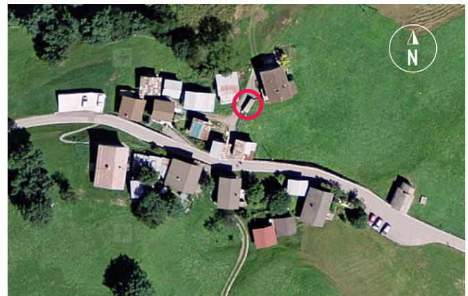
Standort der überdachten Brunnenanlage

Die Brunnröge bestanden ursprünglich vermutlich aus ausgehöhlten Baumstämmen. Vor Jahrzehnten wurden sie durch einen Zementtrog mit zwei Becken ersetzt. Weil in den Brunnen auch Wäsche gewaschen wurde, besaßen sie meistens zwei Tröge. Im oberen mit dem sauberen Wasser tränkte man das Vieh und holte das Brauchwasser für den Haushalt,