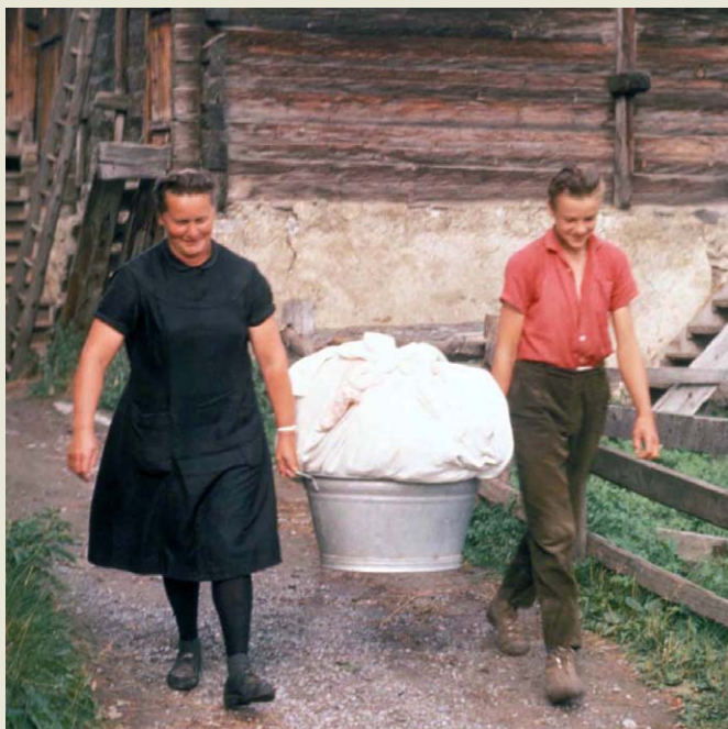
Auf dem Weg zum «Büchhüs» in Grengiols um 1955

tall, Holzbottichen zum Einlegen der Wäsche, Einweich- und Spültrögen und einem Abtropftisch. In den meisten Dörfern des Oberwallis – so auch in Grengiols – diente das «Büchhüs» auch als Schlachthaus mit den dazu notwendigen Gerätschaften wie einer «Schwiimüalta» (ein Holztrög, in dem das ausgeblutete Schwein gebrüht und die Borsten entfernt wurden), einem Schragen, auf dem das Kleinvieh geschlachtet wurde, und einer Metzgerwinde zum Aufhängen des geschlachteten Grossviehs.