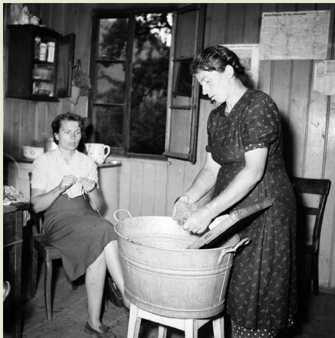
Die «kleine» Wäsche in einer Küche in Grengiols um 1953

Birken. In späteren Jahren benutzte man insbesondere für das Vor- und Nachwaschen auf dem Waschbrett Kernseife.