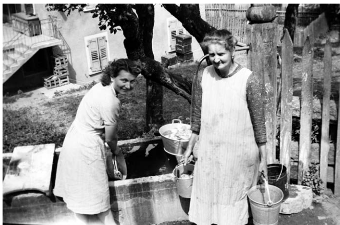
Frauen am Dorfbrunnen in Grengiols in den 1945er Jahren

im untern wurde die in Holzäsche gebrühte Wäsche ausgewaschen. Dieses Laugenwasser war für das Vieh ungeniessbar.