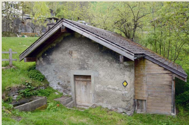
Das «Büchhüs» (Waschhaus) von Grengiols

Die Einrichtung dieser Waschhäuser bestand aus einem gemauerten Ofen mit einem Kessel aus Me-