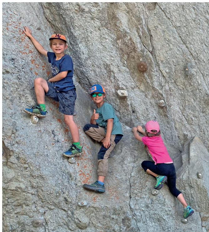
Kletterwand in der Nähe der Grillstelle

Der Zauberwald auf dem Wasen, wo knorrige Rottannen und moosige Felsblöcke eine bizarre Landschaft bilden, bietet Familien mit Kindern im Alter von 3 bis 10 Jahren ein attraktives Ziel für halb- oder ganztägige Ausflüge. Kinder können hier ihrer Fantasie freien Lauf lassen und mit natürlichen Materialien wie Tannzapfen, Ästen, Steinen und Wasser spielen. Bewusst wird nur eine begrenzte Anzahl von individuell an die Landschaft und die Geschichte angepassten Spielgeräten fest einrichtet. Der eigentliche Spielplatz ist die Natur mit unendlich vielen Möglichkeiten. Mit Fernrohren geht's von Posten zu Posten. Und was für Posten! Hängebrücke, Kletterwand, Alphornrutsche, Barfussweg oder ein Holzzug warten darauf, Teil der spannenden Abenteuer der Kinder zu sein. Nach anstrengenden Erkundungstouren und Spielen haben Klein und Gross sicherlich Hunger. Der Grillplatz mit mehreren Grillstellen, Tischen und Bänken ladet zum Verweilen ein.