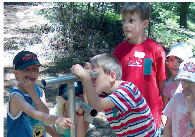
Fernrohre weisen den Kindern den Weg