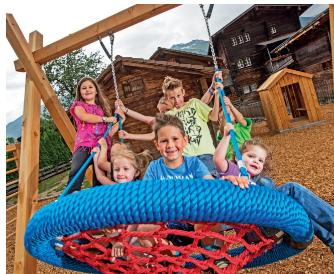
Spielplatz in Ernen

Ab und zu wagt sich Brüna nach Ernen. Sie hat da nämlich zwei Freunde: Der Frosch und die Schnecke freuen sich immer sehr, wenn die Brüna zu Besuch kommt! Die beiden Tiere sind auf dem Spielplatz mitten in Ernen zu Hause und können den Kindern stundenlang beim Rutschen, Schaukeln und Klettern zuschauen. Weitere tolle Spielplätze finden sich neben dem Hotel Ofenhorn in Binn, beim Berghotel Chäserstatt (inkl. Streichelzoo) und in Grenchols, wo neben der Spiel- und Sportanlage auch eine Minigolfanlage und eine grosse Grillstelle zur Verfügung stehen. Weitere Grillstellen befinden sich in Giesse (zwischen Binn und Fäld), in Heiligkreuz (im Lengtal) und Uf en Egga (unterhalb der Alpe Frid).