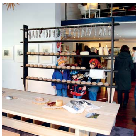
Binner Lärchentisch in Bern

Das Einrichtungshaus Anliker überraschte an den Berner Design Tagen mit einer unkonventionellen Ausstellung. Während die anderen Möbelhäuser auf berühmte Namen setzten, gewährten «die Möbelmacher» dem Landschaftspark Binntal während eines Monats eine prominente Plattform in der Bundesstadt. Vier Holzverarbeitende Betriebe aus Binn, Ernen und Grengiols schufen eigens für die Ausstellung eine Kollektion von Möbeln und Accessoires in Lärche. Besondere Beachtung fanden die Mineralien und am meisten Zuspruch: Käse, Roggenbrot und Hauswürste.