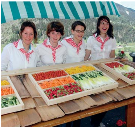
Farbtupfer 06: Damenturnverein Grengiols