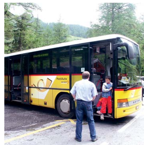
Mit dem Postauto bequem nach Fäld

Aufgrund der soliden Vorarbeiten und der ersten Erfolge sollte das Parkprojekt «Binntal» die Hürden in Sitten und in Bern in ein, zwei Jahren überspringen können. Doch bleiben in der Politik Verzögerungen und Überraschungen immer möglich.